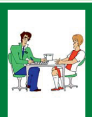
Заполнение протокола допинг-контроля