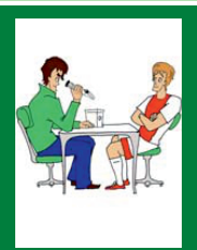
Проверка удельной плотности